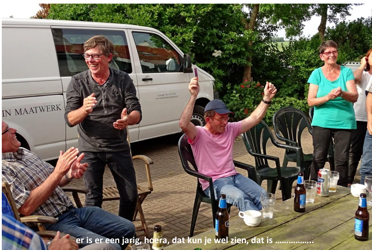
er is er een jarig, hoera, dat kun je wel zien, dat is .....