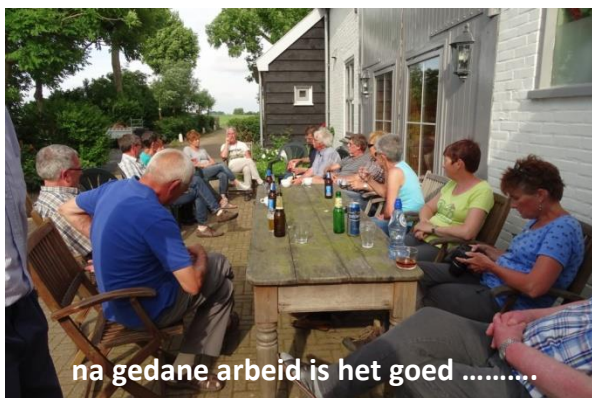
na gedane arbeid is het goed .....