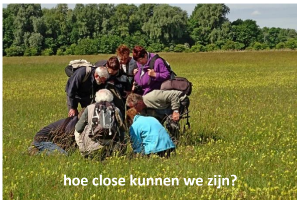
hoe close kunnen we zijn?